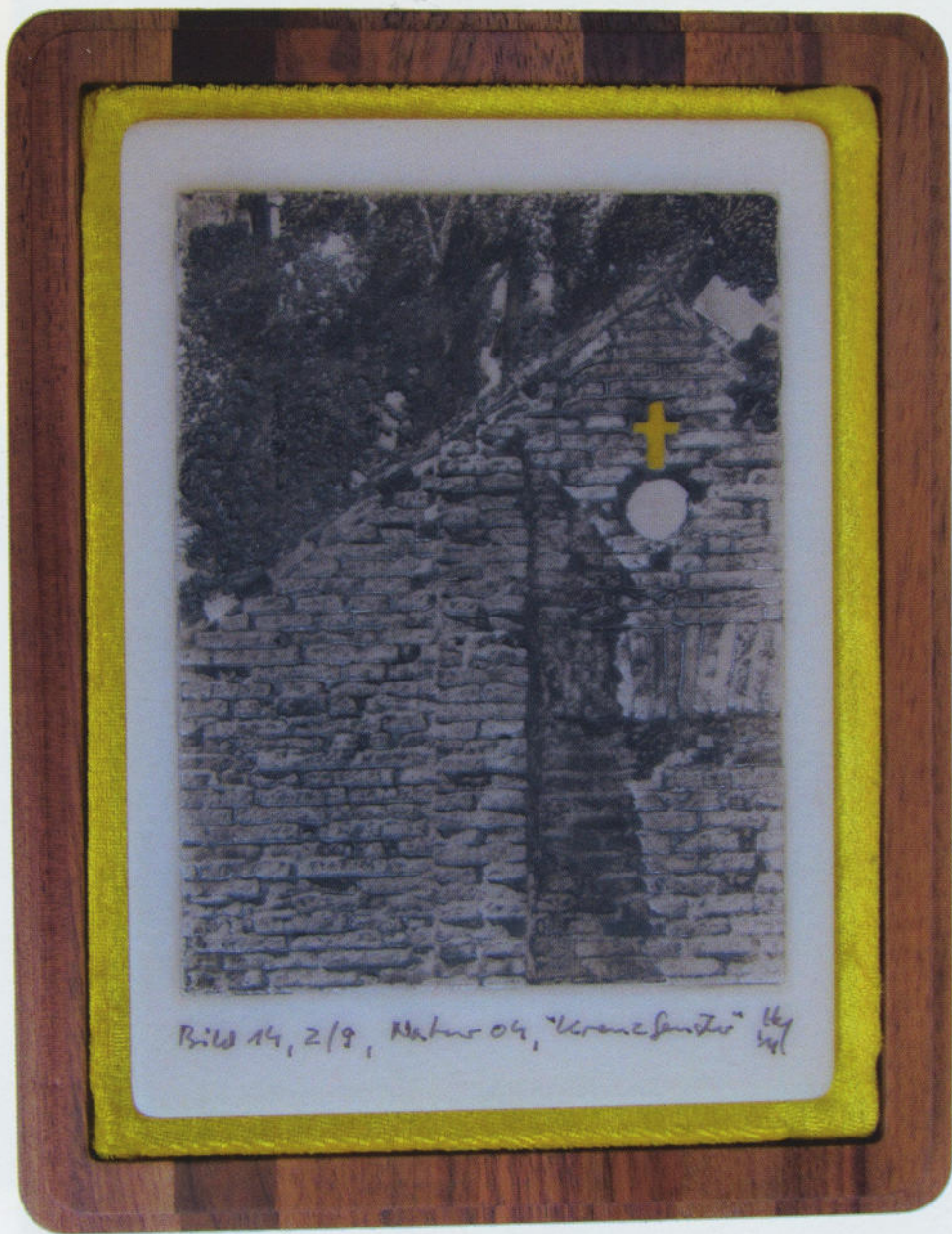
Bild 14, 2/9, Natur 04, 'Kreuzfenster' 16/54