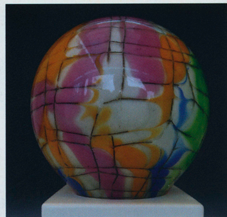
74 „WABENTECHNIK-LAMPE“ (2020) H: 33 cm B: 20 cm T: 20 cm

76 | Theo Sellner ist eines der Urgesteine der Bayerwald-Glasszene. Er ist seit Mitte der 1970er Jahre künstlerisch mit Glas tätig und hat mit seinen Glasobjekten bereits in jungen Jahren der Studioglasbewegung viel zur Vielfalt der Studio-Glaskunst beigetragen. Kameographien ermöglichen die Wiedergabe echter Halbtonbilder aus Glas.