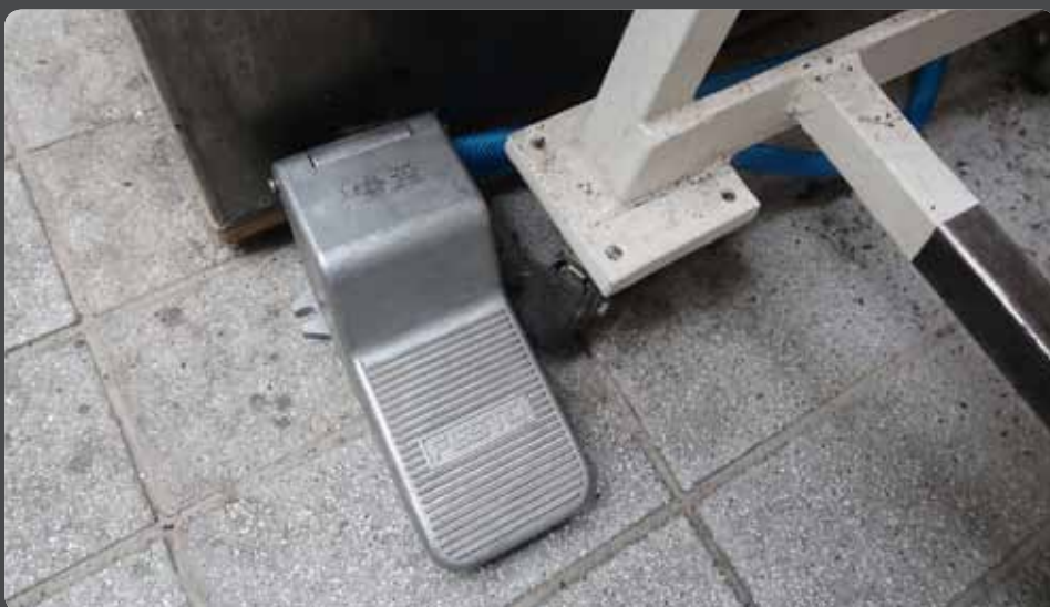
Abb 6: Das Druckluft-Fußpedal

Idealerweise sind für Pfeifen mit unterschiedli-