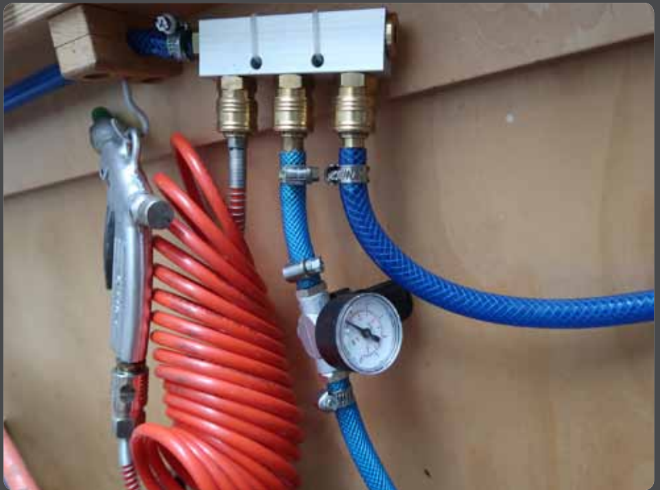
Abb. 2: Druckluftminderer mit Manometer

Es ist auf jeden Fall zu vermeiden, dass die Druckluft zu hoch eingestellt wird. Mit zu hoher Einstellung kann zwar am Objekt länger gearbeitet werden, weil die Druckluft dann auch bei etwas kühlerem Glas noch etwas bewirkt. Die Gefahr, dass ein Glasposten explodiert ist dann allerdings sehr groß. Mit dem Kopf im Bereich des Glaspostens (man beobachtet ja den Aufblaseffekt) können so schwere Verletzungen im Gesicht und vor allem in den Augen entstehen!