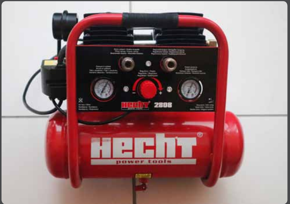
Abb. 11: Minikompressor mit zwei Druckluftanschlüssen

Abbildung 11 zeigt einen solchen Minikompressor. Er ist für die vorliegende Aufgabenstellung besonders geeignet, weil er nicht nur die oben genannten Vorgaben erfüllt,