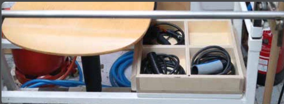
Abb. 9: Box mit vier Fächern für unterschiedliche „Blowpipe Hose Extensions“

In Abbildung 10 sind alle Elemente der Pneumatik-Glasmacherbank übersichtlich zusammengestellt. Sie bestehen, wie erläutert aus Druckminderer, Fußpedal, Blowpipe Hose Extension sowie Kupplungselemente und Verbindungsschläuche.