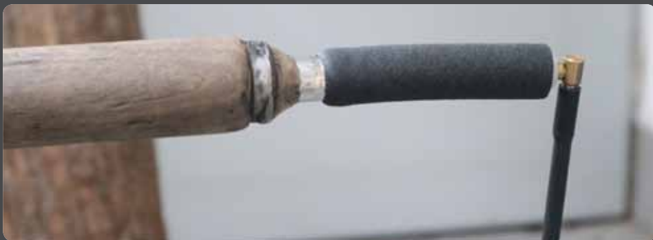
Abb. 5: Kupplungselement der „Blowpipe Hose Extension“ an das Mundstück der Pfeife angesteckt

Im englischsprachigen Raum wird diese Schlauchverlängerung als „Blowpipe Hose Extensions“ bezeichnet. Derartige „Mundstückverlängerungen“ können von verschiedenen Firmen, vorzugsweise im englischsprachigen Raum, unter dem Stichwort „Blowpipe Hose Extensions“ recherchiert und bezogen werden. z. B. von Steinert Industries Inc., USA ( www.steinertindustries.com )