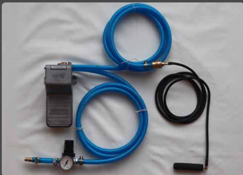
Abb. 10: Darstellung aller Elemente der Pneumatik-Glasmacherbank