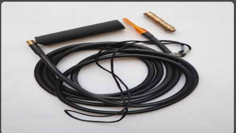
Abb. 3: „Blowpipe Hose Extensions“ ein Gummischlauch mit Mundstück für den Glasmacher und Kopplungselement zum Ankoppeln an das Mundstück der Glasmacherpfeife, daneben eine Druckluftkupplung