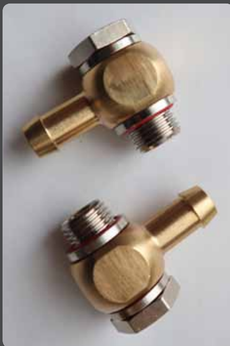
Abb. 7: L-Gewindetüllen zum Anschluss der Druckluftschläuche an das Fußpedal

Das Pedal muss zwei Schaltstellungen aufweisen und sollte eine Federrückstellung haben, damit es, wenn man den Fuß wegnimmt, allein in die Anfangsposition zurück geht (3/2, nicht rastend, geschlossen, monostabil)). Gut geeignet ist das Fußventil der Firma FESTO: Fußventil F-3-1/4-B, Teilenummer: 8984, Lieferant: Fa. Lan-