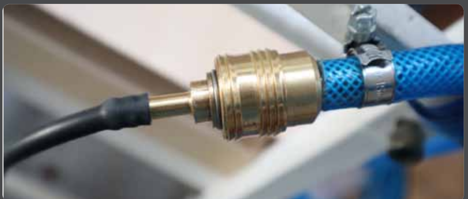
Abb. 4: Druckluftkupplung zum Verbinden des Schlauchs der „Blowpipe Hose Extension“ mit der Druckluftversorgung