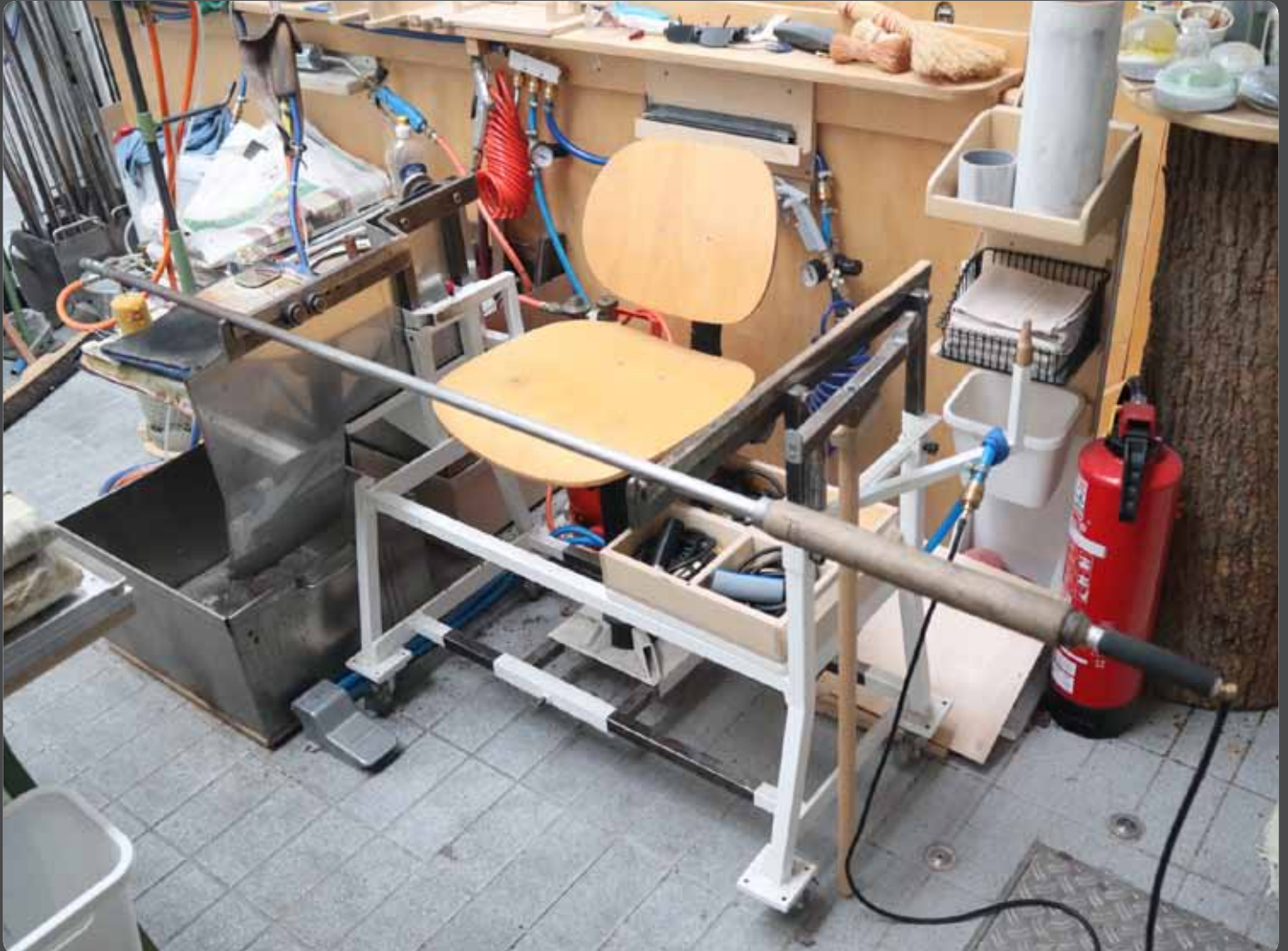
Abb. 1: Glasmacherbank mit Glasmacherpfeife und Druckluftschlauch

Gerade in Corona-Zeiten ist das Glasmachen im Team durchaus problematisch geworden. Das Benutzen der Glasmacherpfeife durch mehrere Personen im Team, insbesondere in Bezug auf das Pfeifen-Mundstück, erhöht die Gefahr der Infektion und sollte deshalb aktuell unterlassen werden.